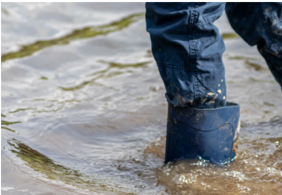
Inondations d'octobre 2024 : un comité de pilotage pour agir concrètement