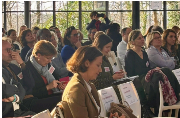
CPTS Yvelinoises : agir ensemble pour l'accès aux soins et l'attractivité des territoires

J'ai participé cette semaine au Comité de Pilotage organisé par le Préfet des